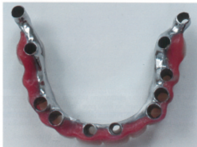
Slike 7a i 7b: Definitivni most spreman za cementiranje prikazan je s okluzalnog i bazalnog aspekta. Fiksacija sprovedena primenom Fuji Plus cementa. Od kompozita su izrađeni zubi i gingiva.