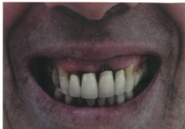
Slika 5: Pre-operativni klinički nalaz: U gornjoj vilici potpuni izostanak interdentalnih papila, generalizovana parodontopatija, obilje karijesa. Glavne tegobe pacijenta: 1. Neprihvatljiva estetika 2. Česti bolovi i infekcije u usnoj duplji

Svi zubi su ekstrahovani, počevši sa zubima gornje vilice. Višak kosti uklonjen je u gornjoj i donjoj vilici, ugrađeni su dentalni implantati (Slika 6). Odmah po hirurškoj intervenciji, uzeti su otisci i izrađeni su modeli za analizu i registraciju visine zagrižaja. Kasnije istog dana izvršena je proba postave zuba (Slika 7).