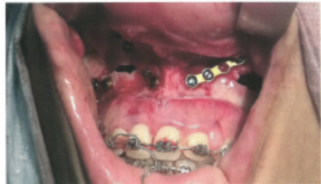
Slika 2: Intraoperativni nalaz: nakon što je gornja vilica podvrgnuta osteotomiji, uklanjeno je 9 mm kosti vertikalno. Osteosinteza je sprovedena mini pločama.

3. Hirurška faza: Le Fort I u gornjoj vilici sa kranionalizacijom maksile nakon uklanjanja 6 mm kosti i genioplastikom u cilju korekcije brade. Fiksacija je učinjena primenom titanijumskih pločica od 2mm, kao i šrafova dimenzija 2mm x 6mm (Slike 2 i 3). Ova hirurška intervencija je sprovedena u opštoj anesteziji uz prisustvo brojnih članova medicinskog tima, uključujući doktore, sestre i anesteziologa. Trajanje hirurške procedure iznosilo je 3.5h. Ceo postupak produžen je na 5 dana uključujući prijem u bolnicu, kao i otpust.