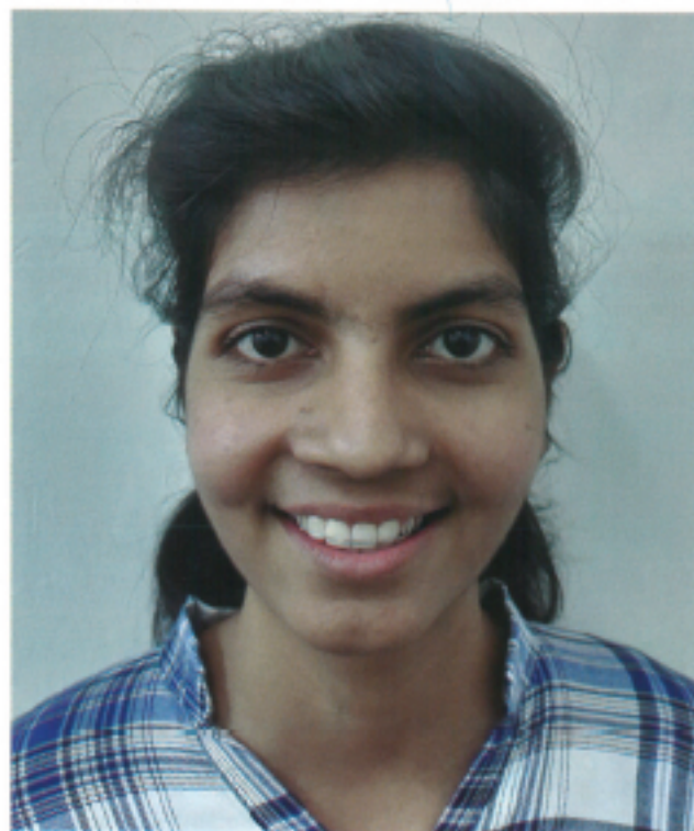
Slika 4: Post-operativni prikaz pacijentkinje nakon 3 meseca. Fiksni aparat je uklonjen i pacijentkinja nosi mobilni aparat za retenciju.

5. Post-hirurška ortodontska faza: Pacijent je ponovo upućen ortodontu u cilju fine korekcije okluzije u periodu od okvirno naredna tri meseca. (Slika 4).