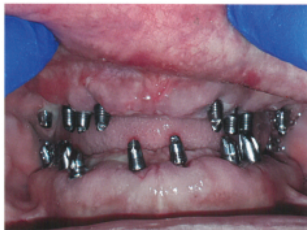
Slika 6: Trećeg postoperativnog dana uočava se povoljno zarastanje rana. Oko 0,9 mm kosti uklonjeno je u gornjoj vilici, kao i oko 0,5 mm u donjoj. Uklonjen je višak mekih tkiva.