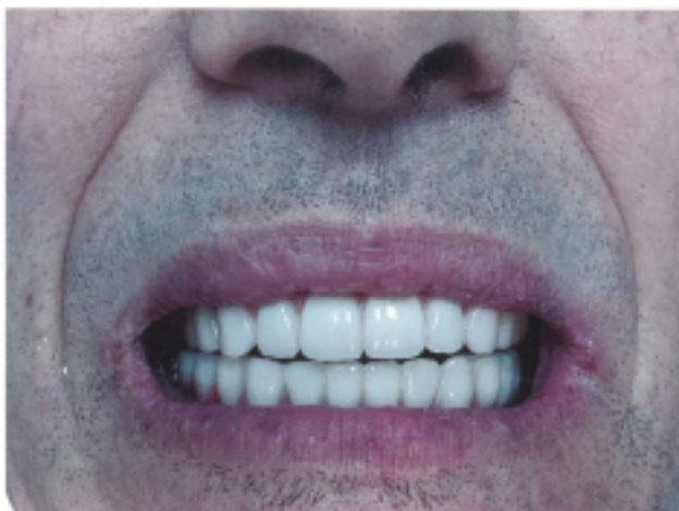
Slika 9: Klinička situacija (osmeh) nakon predaje protetskog rada. Usled adekvatnog uklanjanja kosti, gornja usna pokazuje bolju potporu.