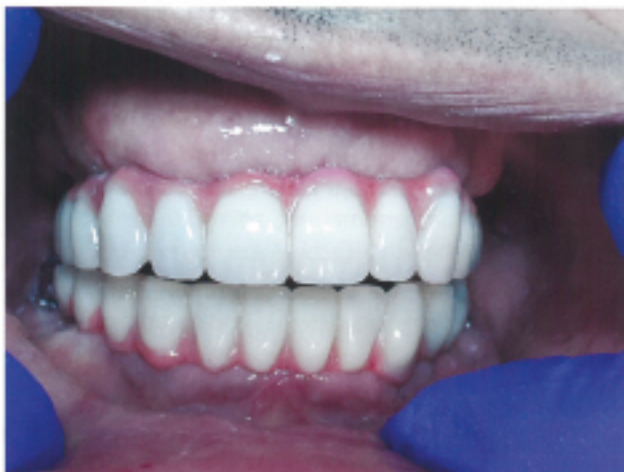
Slika 8: Intra-oralni prikaz u obe vilice nakon cementiranja mostova. Distalni tehnički abatmenti nisu fasetirani kako bi higijena u posteriornim segmentima bila olakšana/poboljšana.