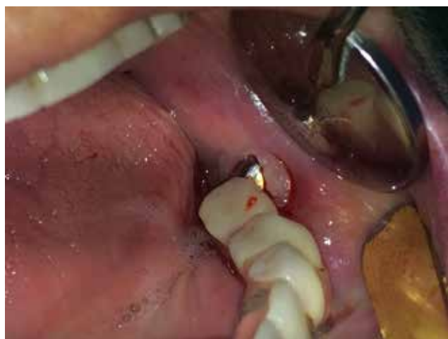
Рис. 3а: Мягкая ткань разрослась за пределы технического абатмена, очистка этой зоны стала невозможной. Это привело к снижению качества жизни пациентки.