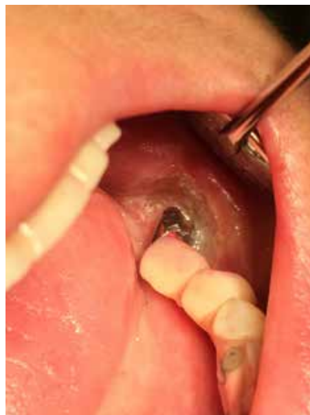
Рис. 3b: Клиническая картина нижней челюсти на дистальном участке после того, как мягкие ткани обработали электрическим прибором для прижигания. Однако стабильный результат и отсутствие инфекции достигнуты не были: через несколько недель ситуация вновь стала похожа на показанную на рис. 3а.