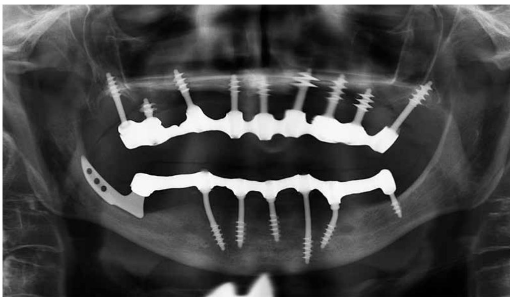
Рис. 1: Общий вид: на снимке видно два циркулярных моста на 9 имплантатах в верхней челюсти и 7 имплантатах в нижней челюсти. Имплантат в левой дистальной части нижней челюсти входит в костную ткань со стороны языка, имеет общую длину 10 мм, около 6 мм находится внутри костной ткани.

Спустя 40 месяцев после установки имплантата в нижней челюсти, пациентка сообщила о болях и отеке вокруг имплантата снизу слева в дистальной части нижней челюсти. Для того, чтобы сохранить имплантат, мы провели местную операцию на мягких тканях вокруг имплантата.