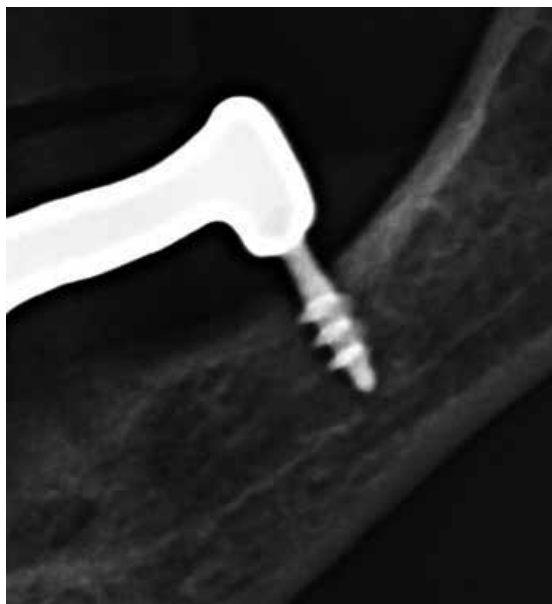
Рис. 2: Имплантат в дистальном участке нижней челюсти спустя 8 месяцев: общий вид. По сравнению в рис.1, какие-либо изменения отсутствуют.